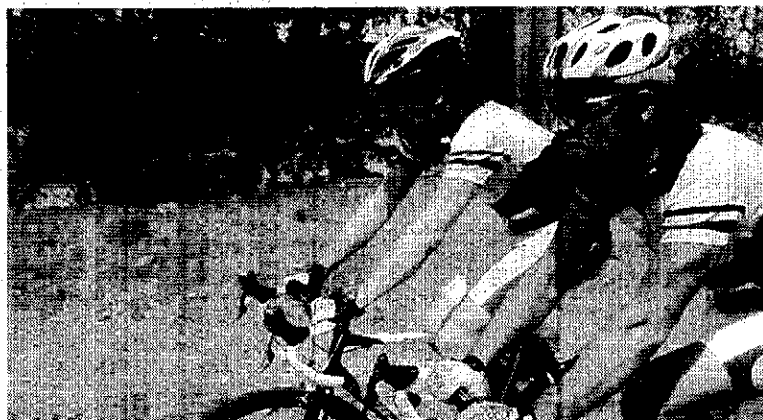
En ruta. Participantes en la cita ciclista.

El Patronato Municipal de Deportes apoyó una vez más las iniciativas encaminadas a promocionar cualquier aportación a la actividad en Almería, más aún en Feria, en los que además de deporte se promueve la solidaridad y la convivencia.