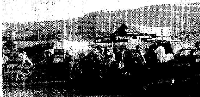
Espera. Momento del encuentro en la primera ruta. :: IDEAL